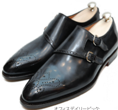
オフィスデイリーピック: De La Ville by Bontoni