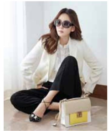
サルバトーレ・フェラガモ (Salvatore Ferragamo) ウェブ: www.ferragamo.com/shop/en/uk/women/eyewear

さあ、今年はグラマラスに見せてくれるフェラガモのサングラスで長く続く香港の夏のルックスを完成しよう。