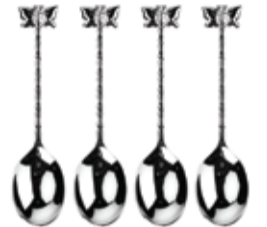
Silver-Plated Teaspoons with Butterfly :HKD175

まもなくやってくる母の日のために、贈り物や食事などさまざまな計画をしている方も多いのでは? 母親と頻りに会うことの出来ない方や、いつも一緒に過ごしているけれどなかなか感謝を口にできない方にとって母の日は、日頃の感謝と愛を形に表す絶好のチャンスだ。そこで今回は、豪華なライフスタイル製品を販売する「TOWN HOUSE」から、実用的で、キラキラと輝いた女性が喜ぶ商品を紹介しよう。