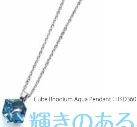
Cube Rhodium Aqua Pendant :HKD360