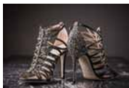
Jimmy Choo: Shimmer Leather Crystal Embellished Sandals (HKD16,300)

また、お洒落な新婦は、ドレスからちらりと見える靴選びにも時間をかけたいもの。数ある高級ブランドの中で、新婦の間で絶大な人気を誇るのが「Jimmy Choo」だ。なかでも、キラキラ輝くクリスタルのシマーレザーを用いた靴は、サマーシーズンに最適。さらに、「Roger Vivier」や「Rupert Sanderson」からは、白を基調にアクセサリをあしらったシンプルだけど存在感のある靴が登場、どんなドレスにも合うデザインで足元を華麗に彩ってくれる。