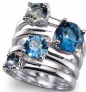
Duo Rhodium Blue Ring :HKD540