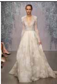
Central Weddings: Monique Lhuillier - Winslet (HKD40,000~120,000)

一生に一度の特別な日のために... 50点以上の上質なブライダルアイテムが勢揃い!