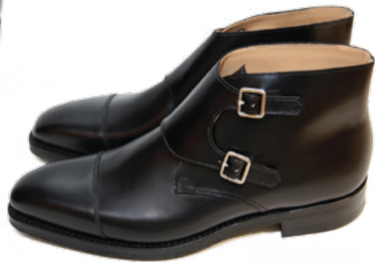
ホットピック: Camberley by Crockett and Jones

高級紳士靴のセレクトショップとして、中環(セントラル)のビジネスマンらに愛され続けている「TASSELS(タッセルズ)」。伝統的で上質な紳士靴の中から、丁寧なカウンセリングと豊富な知識で、訪れた人にピッタリの一足を選んでくれる。国外のファンも多く、わざわざ日本から足を運ぶ人もいるのだとか。取り扱うのは、オールデン(Alden)、エドワードグリーン(Edward Green)、ボントーニ(Bontoni)、リヴォルタ(Rivolta)、クロケット&ジョーンズ(Crockett & Jones)などの高級ブランド。