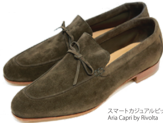
スマートカジュアルピック: Aria Capri by Rivolta