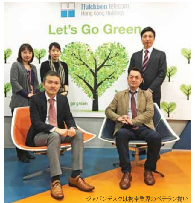
ジャパンデスクは携帯業界のベテラン揃い

現在、この春香港に来たという人や、他社からの乗り換えの人向けの「ウェルカムプロモーション」を実施中。法人・個人問わず8月末まで受け付けているということで、時間差で来港する家族にも使えるのが嬉しい。気になる人はまず彼らに相談してみよう。