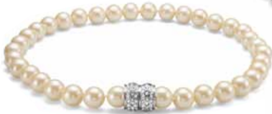
Lucent Creme Rhodium Crystal Pearl Necklace :HKD910