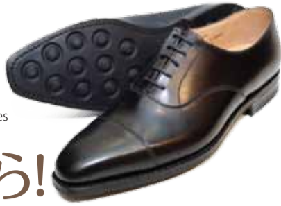
ベストレイニーシューズ: Hallam by Crockett and Jones