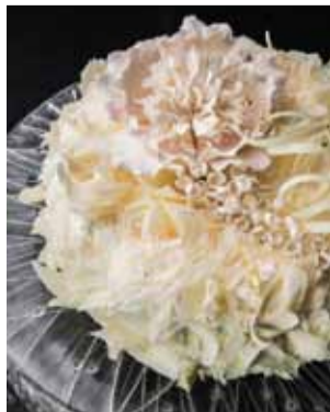
CIAC - In The Kitchen: Pistachio cake (3lbs) (HKD520)

ゴージャスでフェミニンなドレスを展開する「Central Weddings」からは、肩紐のないストラップレスドレス、クラシックレースを用いたロマンチックで豪華なデザインのドレスなど、どんな挙式スタイルでも合うような様々なドレスが登場。そのほかのブランドからは、蝶をイメージした淡いピンク色の「Chloé」のドレス、「Dolce & Gabbana」のビビットな花柄ドレス、「Giorgio Armani」のボヘミアンなイブニングドレスを揃え、どれも個性豊かなデザインで魅力がある。