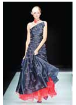
Giorgio Armani: Blue Gauze and Red Organza with All-over Embroidery Dress (HKD338,000)