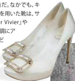
Roger Vivier: Limelight Choc (HKD18,100)

さらにジュエリーには、「Dior」のネックレスや「De Beer」の指輪、「Tayma Fine Jewellery」のアクアマリンとダイヤモンドのネックレス、イヤリング、リングのセットがオススメ。これらは、一度購入したら永遠に身につけることのできる一生モノ、特別な日だからこそいい物を購入して、将来的には母から娘へと代々譲るといっても記念に残るだろう。そのほか、クリスタルの置き物やカード、シャンパングラスなど贈り物にも最適な商品が勢揃い! ぜひこの機会に足を運んでみよう!