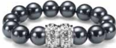
Lucent Dunkjelgrau Rhodium Crystal Bracelet :HKD595