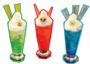
3種のポケモンにちなんだ限定ドリンク

そんなポケットモンスターのキャラクター達が、なんと期間限定で香港ファミリーレストランチェーン「Satay King」にやってくる! 10月25日まで、同店ではポケモンにちなんだメニューを展開したり、限定グッズを発売したり、さらにはピカチュウがお店にグリーティングにやって来るイベントを開催。ポケモンが公式に香港のレストランと提携するのは今回が初めて。ファンにとって見逃せないキャンペーンとなるだろう。