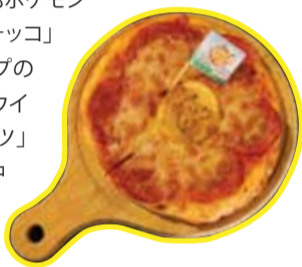
ピカチュウの スパイスソーセージ6インチピザ

また、ポケモンメニューにはポケモンメモ、ポケモンドリンクにはコースターが付いてくるサービスもファンにとっては嬉しい。その他、ピカチュウのマシュ