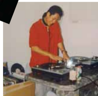
Hiphopがライフスタイルそのもの だったというLA時代