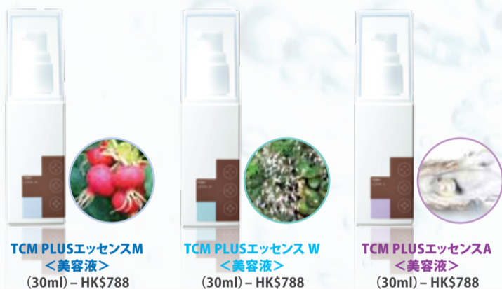
TCM PLUS エッセンスM ＜美容液＞ (30ml) - HK$788