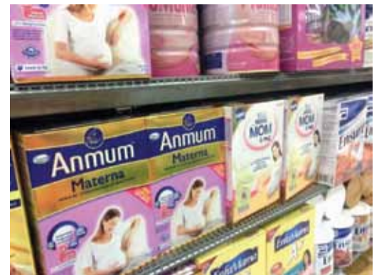
妊婦用粉ミルクは産婦人科医からも薦められます

その親心を見逃すまいと、テレビや看板でよく宣伝されているのが「粉ミルク」。スーパーに行くと「Infant Milk」というコーナーがあり、子供用粉ミルクの缶がずらりと並びます。一缶の値段が日本とあまり変わらないということを考えると一般的なフィリピン人にとっては高い買い物と言えますが、これぞステイタスと言わんばかりに5、6歳くらいになっても哺乳瓶片手に街中を歩く子をたびたび見かけます。日本では乳幼児期を過ぎれば、粉ミルクから普通の牛乳にかえる人がほとんどですが、残念ながらフィリピンでは新鮮な牛乳はなかなか手に入りません。そんな牛乳の希少性がより粉ミルクへの期待値をあげているのでしょうか。「ミルクを飲ませておけば