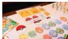
ここでしか手に入らない限定グッズ

ピカチュウの グリーティングスケジュールも Facebookでチェック! www.facebook.com/satayking.hk