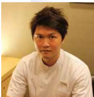
10代の頃、モデルをしていた重森店長。これまで様々なダイエットに挑戦し、様々なサプリメントも試してきたので知識は豊富。香港に来てから、「トリプルバーン痩身法」に挑戦し、その圧倒的効果を実感したという。