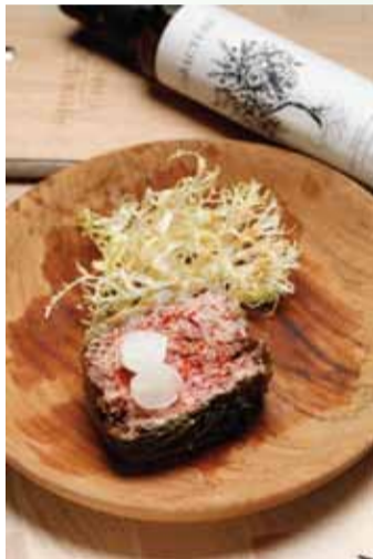
ダックレッグテリーヌ