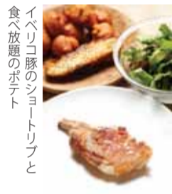
イベリコ豚のショートリップと 食べ放題のポテト

ウッドテイストのテーブルが温かみを感じさせてくれる同店のメニューはランチHKD298(メイン+サイドディッシュ)、ディナーHKD448(前菜、メイン、サイドディッシュ、デザート)。同店の料理は最高品質の食材とアクラム氏の創造性豊かな斬新なツイストが利いており、味わう人を至福の一時へと誘う。