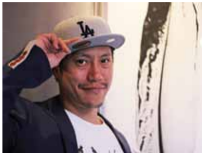
「すべての方に楽しんでいただけるお店にしていきたい」とSoさん

今までのキャリアとは全然違うジャンルではないかと思う方もいらっしゃると思いますが私にとっては全く同じなんです。私のやりたいことは物事を通じて出合った人を喜ばせて幸せにすること。ステージの上で何万人の観衆を前に歌ったりするのも、お店で目の前のお客様に接客するのも、人を喜ばせて楽しませるといふ意味では同じです。そういう意味では毎日がステージのつもりでお客様には対応させていただいています。多くの仲間たちに支えられ今の自分があると思っているので、これからも感謝の気持ちを忘れずに自分らしくありのままにアーティストでありエンターテイナーとして皆さんに接していきたいですね。上環の1号店「298 Nikuya Kitchen」は10月中旬に尖沙咀に拡大移転オープンしますので是非いらしてください。