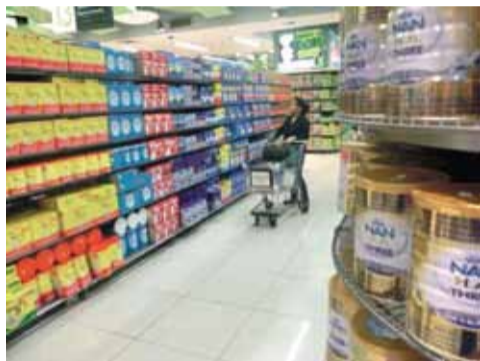
1レーンすべてが粉ミルク売り場。種類も豊富