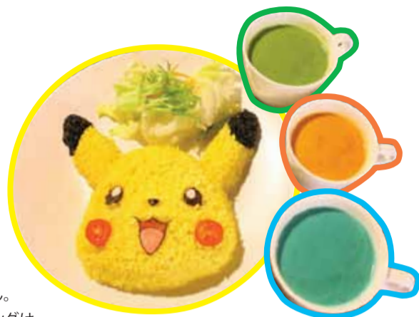
ピカチュウのポークチョップカレーライス

マロやブックマーク、同店のユニフォームに身を包んだピカチュウのネームカード、8種類のポケモンのキーチェーンなど、期間限定グッズも盛りだくさん。ピカチュウのグリーティングは毎週土、日、祝日に各店舗で行われ、スケジュールは予め「Satay King」のフェイスブックページでチェックできる。さあ、この夏期間限定のキャンペーンでポケモンの世界に触れよう!