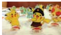
スタッフの制服に身を包んだピカチュウが愛らしい