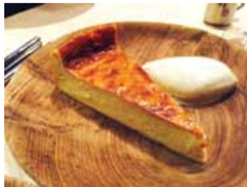
カスタードケーキバニラアイス添え