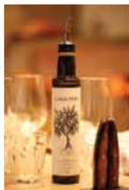
アクラム氏自ら調合した良質 オリーブオイル