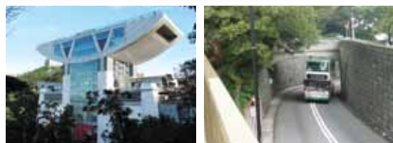
15番中環(セントラル)碼頭行き HKD9.8

香港観光といえば、100万ドルの夜景。この夜景を下から臨むか、上から臨むか…。上から臨む場合は、ご存知の通りトラムで山頂ビクトリアピークへ向かうだろう。帰りは是非、15番中環(セントラル)碼頭行きバスで下山を体験して頂きたい。とってもスリルがあり、まるでジェットコースターに乗っているかのような気分が味わえる。窓からの景色も楽しめる。