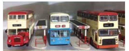
Jackieさんの家に飾られた、バスターミナルを再現した模型

彼が高校生だった頃、乗っていた彩虹邨と佐敦道碼頭を結ぶ13番バス内で出会いは突然訪れた。そこに乗車していたのは、当時のクラスメートだった少女。車番「CL8303」、彼は彼女と出会ったバスの車番をはっきりと記憶している。1986年の夏、このバス内での出会いから甘く純粋なラブストーリーが始まったのだ。模型はその甘い恋の証。眺める度にその時のキュンとして甘酸っぱい思い出がよみがえるという。