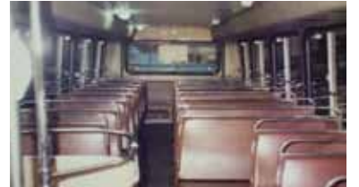
KMB(九龍巴士)から出たエアコン付きのレイランド・オリムピアン(Leyland Olympian)バス。