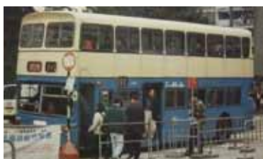
113ルートを守るチャイナモーターバスのダイムラーフリードライン。オイマンバスターミナルまでのルートは道路工事のため度々ルートは変更されている。写真は1997年に撮影。