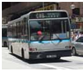
デニスダーツ、香港最後の非フランチャイズの無料一路線バス。写真は北角で撮影。