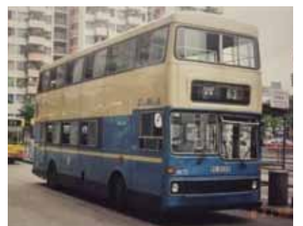
初期のチャイナモーターバスのバス。エアコンなしだが、座席がとても居心地が良い。現在、スタンレー行きのバス260のルートをよく走行していた。