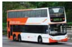
香港のバス路線内訳