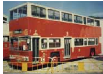
KMCのダイムラーフリードライン。窓が高く設置されていて大人でもほとんど中から外の道の景色を見ることができな。これが原因で香港に人々からはあまり人気になかった。