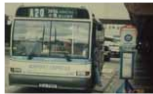
A20、チャイナモーターバスの唯一運営する空港バス。セントラルと啟徳(カイタック)空港間を循環。1998年に啟徳空港の閉鎖により路線は廃止された。もバスもまだ残っている。