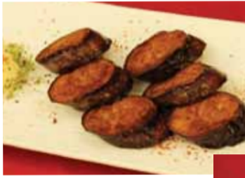
ベジミートを詰めたナスのロースト 「Roasted stuffed eggplant」