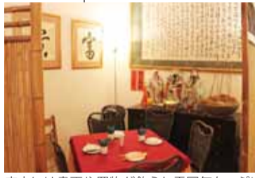
店内には書画や置物が飾られ雰囲気たっぷり

香港にはヘルシーなベジタリアンフードを楽しめるレストランが数多くある。ダイエットや宗教上の問題だけでなく、食生活から健康を見直そうと考えて、ベジタリアンフードを食べる人が少なくないからだ。しかし本当に美味しい料理を出してくれるお店はそうそうない。またベジタリアンフードというと、何だか食べ応えがなく物足りないイメージを持っている人も多いのではないだろうか。