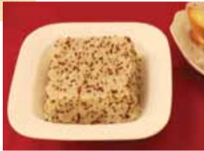
スーパー穀物と呼ばれる 高栄養価のご飯「Quinoa rice」