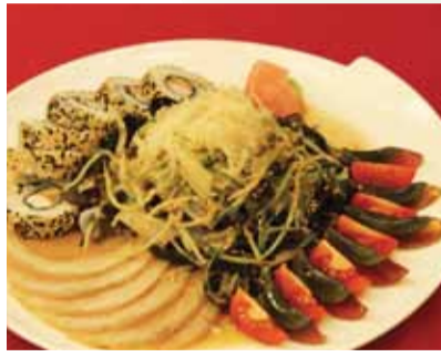
前菜として人気の高い「Cold Platter of Wood Ear, Carrageenan and Sushi」