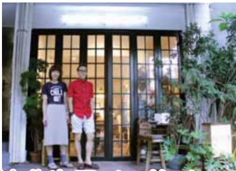
店の外からもお洒落な雰囲気が漂う