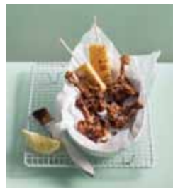
普通の手羽とは全然違う! 「バルサミコ・チキンウイング」