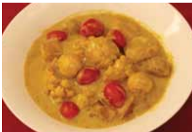
ベジミートボールが入ったボリューム満点の 「Vegetable Coconut Milk Curry」