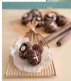
まるで生しいたけ 「キノコのトリュフ包み」

(Signature roasted white king pigeon)は、毎日1店舗あたり1000食もオーダーが入るというほどの人気メニュー。秘伝のソースで一晩漬けた鳩は、脂肪分が少なく、やわらかでジューシー。同店を訪れたら必ず注文したい1品だ。鳩を食べる際は、手が汚れないように鳩用のグローブが用意されており、行き届いたサービスにも満足することだろう。続いてのおすすめは、「キノコのトリュフ包み(Truffle mushroom bun)」。初めて見た人は生のしいたけだと思うかも知れない。実際は、トリュフと新鮮なキノコを混ぜ、しいたけの形に包んだもの。生地を茶色にするために、ココアパウダーを使用しているが、トリュフのほのかな香りも感じることができる。