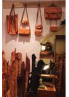
レザーグッズの加工工程も見せてくれた

「レザーはあなたと共に成長します」と語るボルドウィンさん。どこにもない1品を、長年愛用できる上質なレザーで作ってみてはいかが?