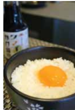
あつあつご飯に新鮮卵は、日本人のこころ!?