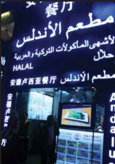
小北駅出口付近は、アラビア文字で溢れかえっている

広州随一の黒人街「小北」の成り立ち ではなぜこの地区にイスラム、アフリカ系の人々が集結しているのだろうか? もともとこの地域は広東省各地のアパレル工場・問屋から売れ残った商品が売買される