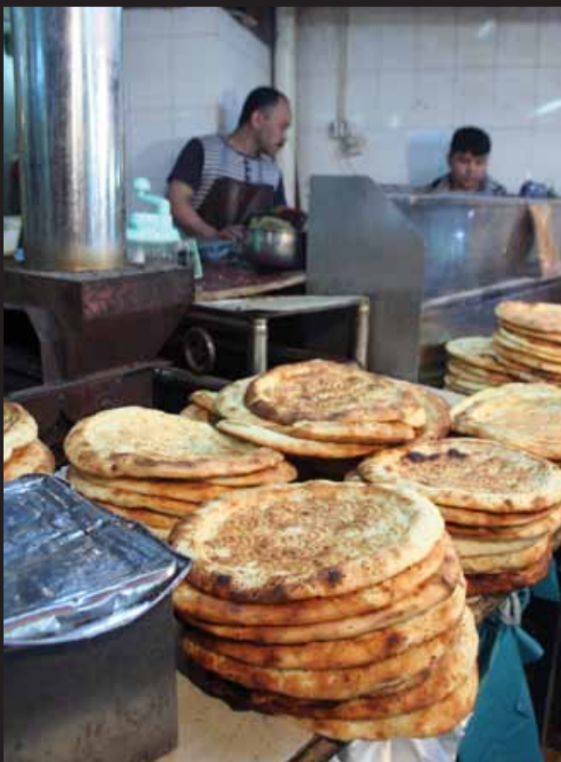
編集部オススメのナン。仄かな甘さが素朴!

る場所であった。そこへ1990年代後半から中東系の商人が集まり始め、対アフリカへの輸出業を手掛け始めた。この中東商人の役割が近年、アフリカ人にとって替わるようになったのは、2006年に中国政府が発表した「対アフリカ政策文書」の影響であると言われている。この文書は対アフリカ政策の基本原則を政治・経済・文化などでの互恵関係と位置づけたものとされ、これにより資源開発や社会インフラ整備として中国からアフリカへの投資が活発に行われた。そんな中で「獲千金」を夢見るアフリカ人ビジネススマンが多く中国へ進出してきたというわけだ。加えて、このエリアの急速な変貌に目を付けた中国人商人までもが集まり始め、熾烈な商売競争が繰り広げられている。