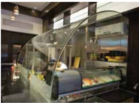
鮮魚は専用のクリーンルームで調理されるので安心!

さらに、鮮魚などのナマ物は専用のクリーンルームで調理・保管するなど衛生面の管理も徹底しているため刺身も安心して楽しめる。そんな同店のオーナー当初からの人気メニューは、アツアツで柔らかな「カツサンド」、ポリウム満点の「ナポリタン」、専用の「卵かけご飯のタレ」で食べる「生卵ぶっかけご飯」。日本料理店の多い南山地域と言えどもあまりお目にかかれない嬉しいメニューを数多く取り揃えているため遠方からわざわざやってくる人も多いのだとか。