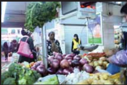
「リトル・アフリカ」内の食品市場

のが並んでいる。一見すると中国で見られる普通の光景なのだが、よくよく見てみると店頭立つ人の殆どが中東・アフリカ系の顔立ちをしている。