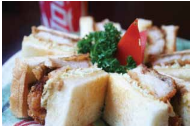
肉厚でジューシーなロースカツを贅沢に使った「カツサンド」!