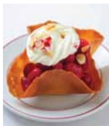
お花のような可愛い姿が特徴のデザート。その名も「チューリップ」