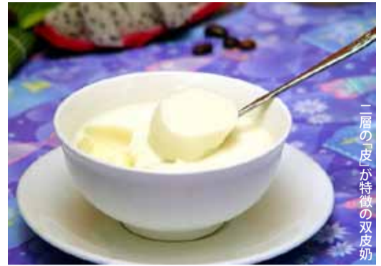
二層の「皮」が特徴の双皮奶