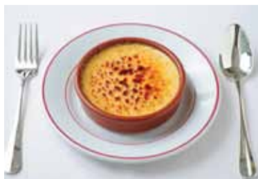
フレンチデザート定番「クريمブリュレ」