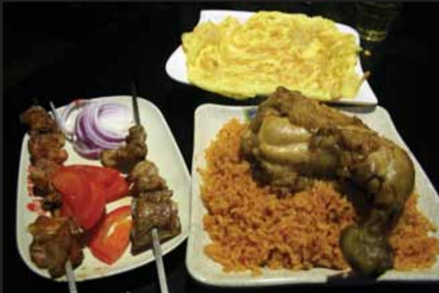
香辛料たっぷりのアフリカンテイストな料理は是非味わいたい

さらに同駅D出口付近にあるトンネルを抜けると「リトル・アフリカ」が現れる。アフリカ系のレストランはもちろん、衣類から電化製品、食品市場など生活に関するあらゆるものが並んでいる。一見すると中国で見られる普通の光景なのだが、よくよく見てみると店頭立つ人の殆どが中東・アフリカ系の顔立ちをしている。