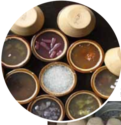
見た目もかわいらしい 砵仔糕