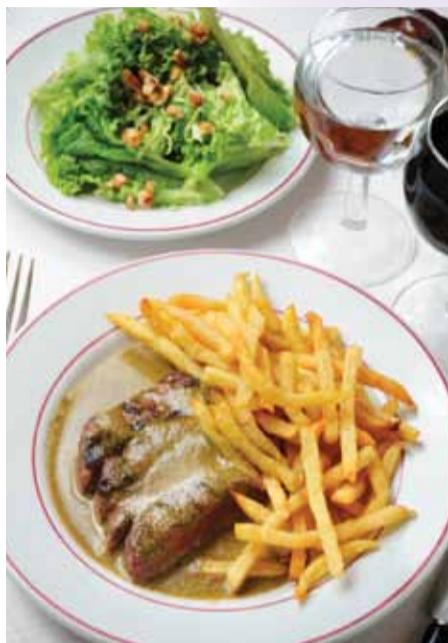
唯一のメニュー「ステーキセット」はフライドポテトとクルミサラダ付き

レストランのオープンラッシュが続く香港。その中でも最近特に注目なのがワンチャイ(湾仔)だ。今回はそんな話題のエリアに新しく仲間入りしたパリスタイルのステーキレストラン「le “Relais de l’Entrecôte”(ル・ルレ・ドゥ・ラントルコート)」を紹介しよう。同店はパリに本店があり毎日行列のできる人気店として有名なお店。そんなパリジェンヌ、パリジャンに愛される同店が、初となる海外店を香港にオープンさせたことあり今話題を呼んでいる。