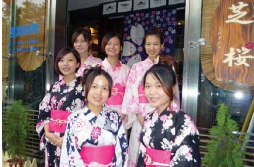
しっかりと日本語も話せる元気なスタッフたち