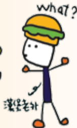
ミスターバーガー (外国人)

「ご飯を食べましたか?」は、年配の中国人にとっては、日常的に使われる挨拶の言葉です。この言葉のルーツは、中国の食糧難時代にあるようです。