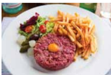
新鮮な牛肉を使っているからこそいただける「ビーフタルタル」