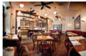
ウッド調の落ち着いた雰囲気の店内