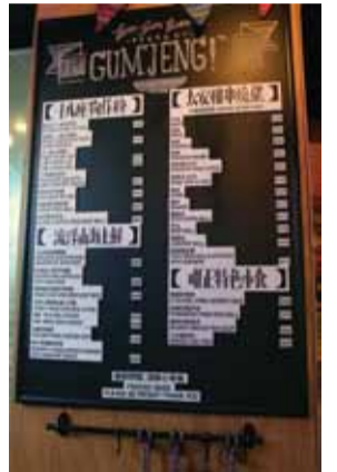
メニューには懐かしのローカルB級グルメがいっぱい

ショップでお買い物をした後、香港スナックを味わいながらカフェでゆっくり休むのも良いのでは? 街中のコーヒーショップのように込み合うことはないのでは穴場かも!