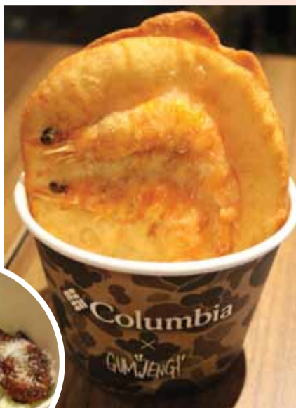
エビが丸ごと入った「怀旧炸蝦餅」