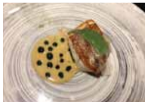
鯛のグリル、白バターとレモンソース添え