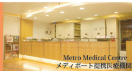
Metro Medical Centre メディポート提携医療機関