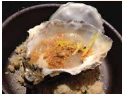
オイスターにヘイゼルナッツ、ブララインとレモン