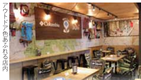
アウトドア色あふれる店内