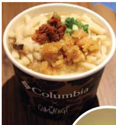
犬のしっぽのような麺が特徴「十八座狗仔粉」