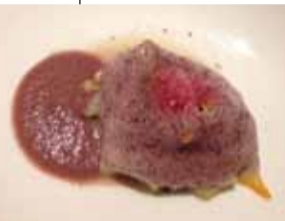
貝の出汁のエスプーマワイン仕立て

フランスのパリの高級住宅地と知られる16区に2011年にオープンし、1年でミシュラン1つ星を獲得し瞬く間に話題の人になった若手33歳の実力シェフ、アクラム氏のフレンチレストラン「Akrame」。オープン当初から分子ガストロノミー(分子美食家)手法を取り入れた斬新なパリの最先端の料理を求めて、予約が難しいといわれるほどの話題になった。昨年には初の海外店として香港店をオープン。今話題の湾仔(ワンチャイ)のシップストリート(Ship St.)にオープンした香港店はパリの本店同様グレーを基調にし、アクラム氏の大好きな色だという黒でアクセントをつけモダンシックで落ち着いた雰囲気だ。ユニークで遊び心があり、見ても食べても楽しめる新感覚のメニューが味わえる。そんな同店が、先月発表されたミシュラン2015でパリの本店同様、なんとオープン1年目で1つ星を獲得するという快挙を成し遂げた。