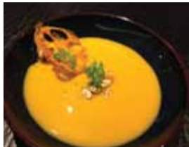
カボチャとウニのスープ