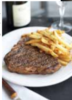
「ステーキとサクサクのフレンチフライ」