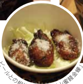
ビールとの相性抜群の「流浮山蜜餞金蠔」

コーズウェイ(銅鑼灣)の喧騒から少し離れたエリア「Fashion Walk(ファッションウォーク)」には、お洒落なお店やレストランが並んでいる。4人の香港人デザイナーがオープンしたセレクトショップ「GUMGUMGUM」もここに店を構える。「生活における休息と回想のひとつ」をコンセプトに小物、雑貨、家具、ファッションアイテムなどスタイリッシュかつ便利でお洒落なアイテムを取り揃えている。