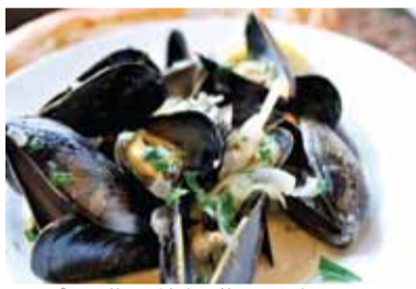
スープは最後の一滴まで飲み干したい「ムール貝の白ワイン蒸し」