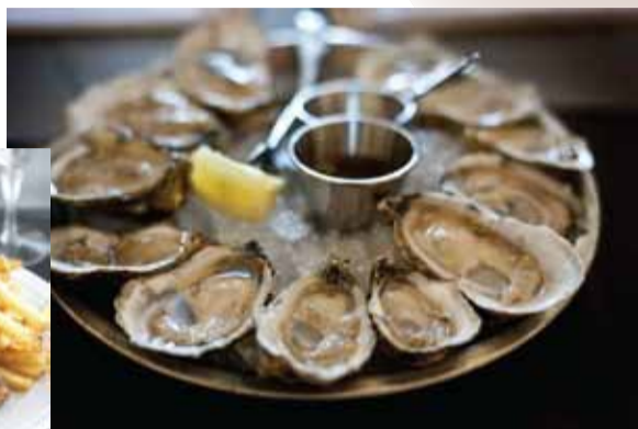
何個でも食べられそうな「ニュージーランド産のオイスター」