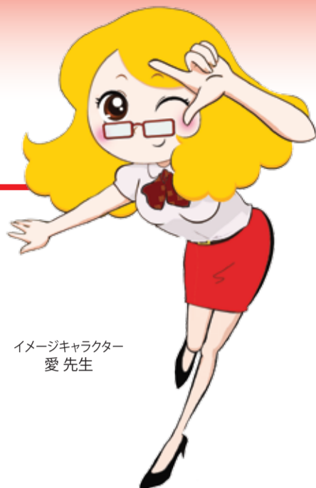
イメージキャラクター 愛先生