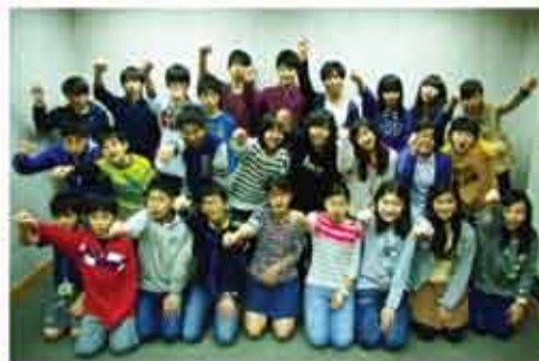
香港地区の小6&中3の卒業パーティー。