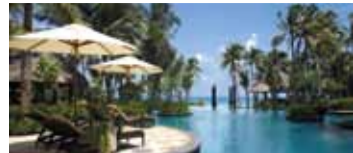
【A】シャングリラ ボラカイ リゾート&スパ (Deluxe Seaview)

した時間が過ごせる。【B】は白く美しい砂浜のビーチフロントにあり、白と青のコントラストが鮮やかなホテル。全室スイートルームでおしゃれなインテリアで内装されている。近代的モダンなデザインで清潔感あふれるリゾート。【C】は地域最大1,200平方メートルのプールとアジア的建築物が自慢のリゾート。国際的なお料理を提供するカフェ、ジム、ビジネスセンターや癒しのスパを併設し、贅沢な寛ぎを体験できる。旅程、料金等の詳細に関してはウェブでご確認を。