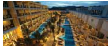
【C】ヘナン ガーデン リゾート(Premier Pool Access)