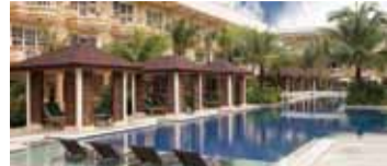
【B】ディスカバリーショア ボラカイ(Junior Suite)