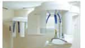
最新鋭歯科用CT 導入(ドイツ製)

深圳市南山区南山大道1122号鹏愛医疗美容医院二階 電話: 0755-8650-0166 FAX: 0755-8622-4459 E-mail: paiyake@pengai.com.cn