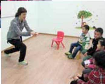
インドア英語クラスの風景