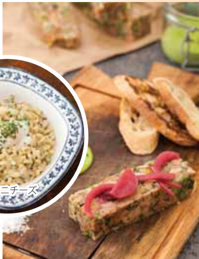
アヒルとハムのテリーヌ

ハリウッドロードをションワン(上環)に向かって歩いていくと、セントラル(上環)の中心よりも落ち着いてお洒落なレストランやバーが軒を連ねている。場所柄、欧米人が多いが、チャイニーズ・アンティークのお店が立ち並び、西洋とアジアが混じり合うノスタルジックな雰囲気も漂う界隈だ。そんな中に、香港でもとりわけ人気のあるステーキレストラン「Blue Butcher」がある。同店は数々の人気レストランを展開するMaximal Conceptのお店だ。