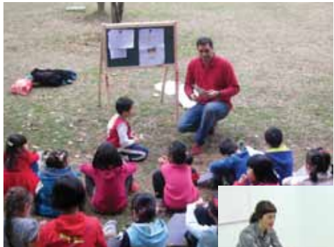
アウトドア英語クラスの風景