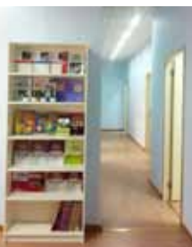
中国語、英語、日本語の書籍コーナー