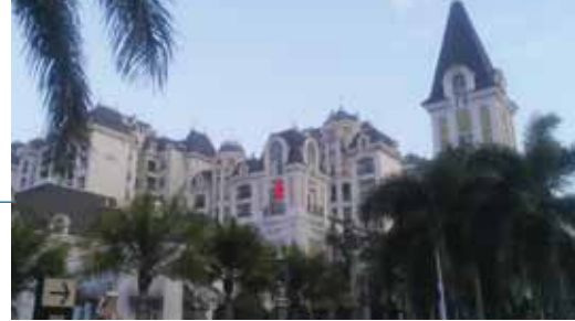
校舎はヨーロッパ風の金海岸花園にある