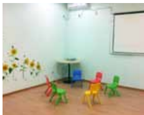
少人数で展開する子供英語クラス

新しい事を始めたいくなるこの季節、言語学習はいかが? 中国語を身に付けたいと思いつつも、きっかけがないとなかなか始められない人も多いのでは? そんな番禺に住む日本人に朗報! 2月23日、「哈沃教育」(Hover Education)が開校した。これまで、番禺には日本人向けの語学学校が少なかったため、どこへ通えばよいのかと困っていた方もいるはず。場所は、地下鉄「番禺広場」駅から清河東路を東へ車で10分、閑静な高級住宅街が広がる「金海岸花園」だ。街の喧騒から離れ、まさに教育に最適な場所にある。